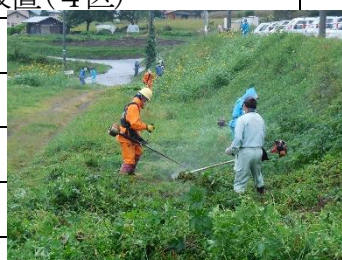
草刈りやろうよ!隊