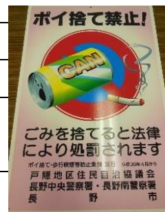
ゴミのポイ捨て啓発看板